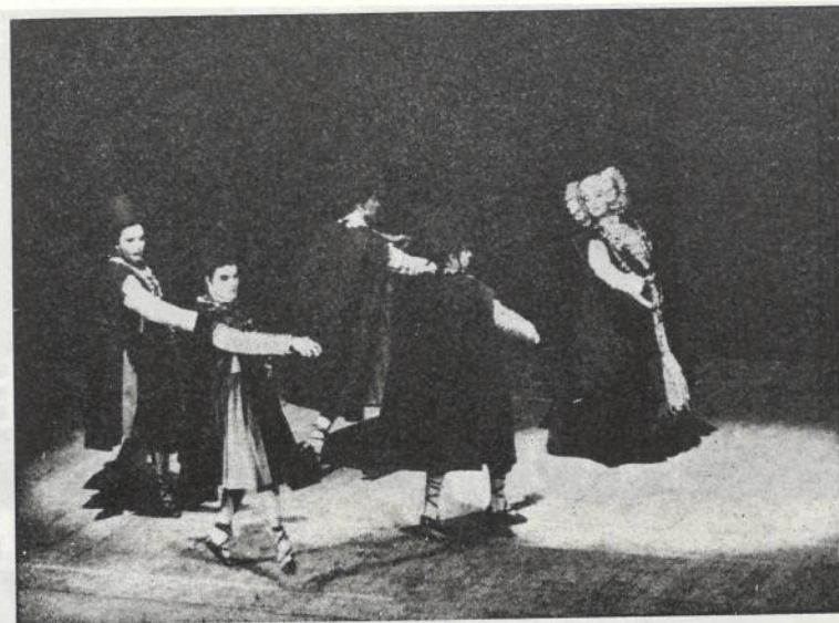
LA DAMA D'ELX

Mañana a las 11, Solemne Oficio y Sermón en la Iglesia Parroquial en honor al Sagrado Corazón de Jesús, con asistencia de Autoridades, Jerarquías locales y Cruz Roja Española.