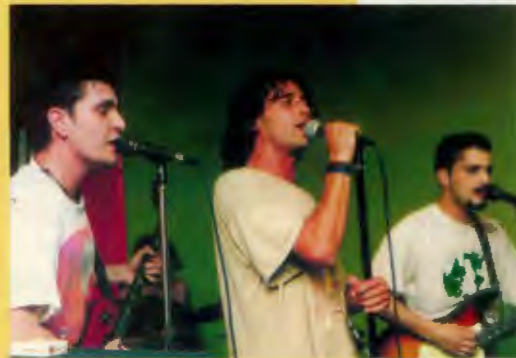
The Mal en Peor